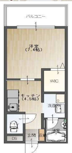
間取り図 (反転タイプあり) ※現況を優先します。