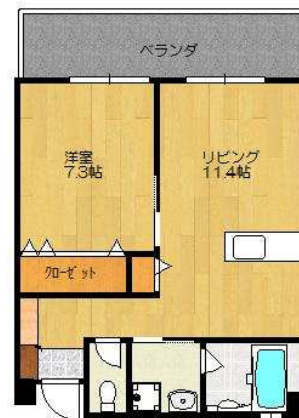
パ-ラダ 東向き(概略)