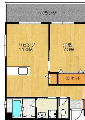
パ-ラ-ン-ダ 東向き(概略)