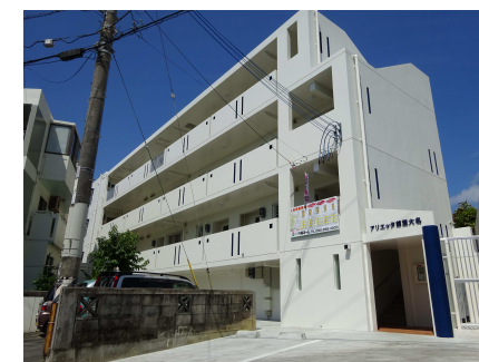
ベランダ 東向き(概略)