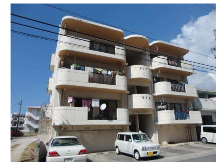
パランダ 南向き(概略)