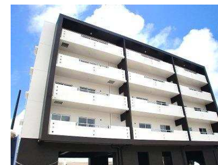
パランダ 南東向き(概略)