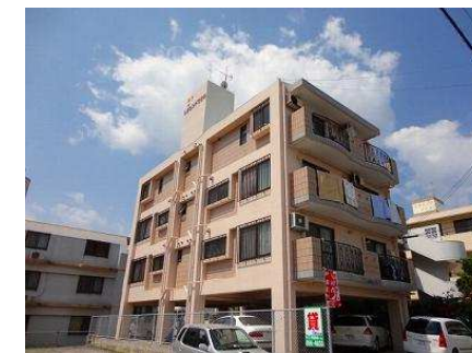
バルコニー 南西向き(概略)