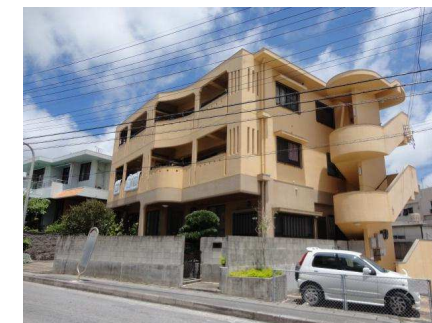
ベランダ南向き(概略)