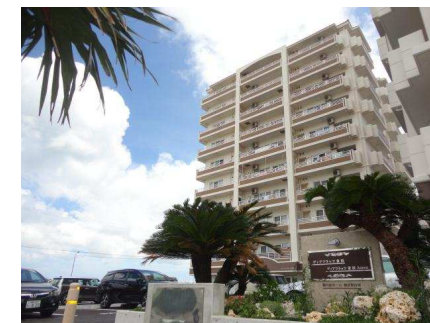
ベランダ 南西向き(概略)