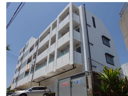
ベランダ 北向き(概略)