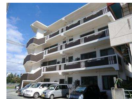
ベランダ 南向き(概略)