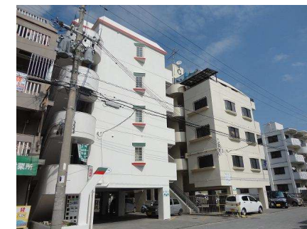
ベランダ 北東向き(概略)